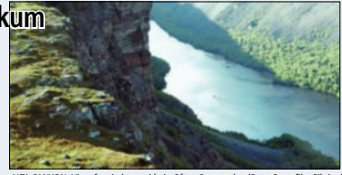
ALTA CANYON: Viser fra sin beste side i «Gåten Ragnarok».

– Jeg er virkelig imponert over det han har fått til. Det er det bare å ta av seg hatten for.