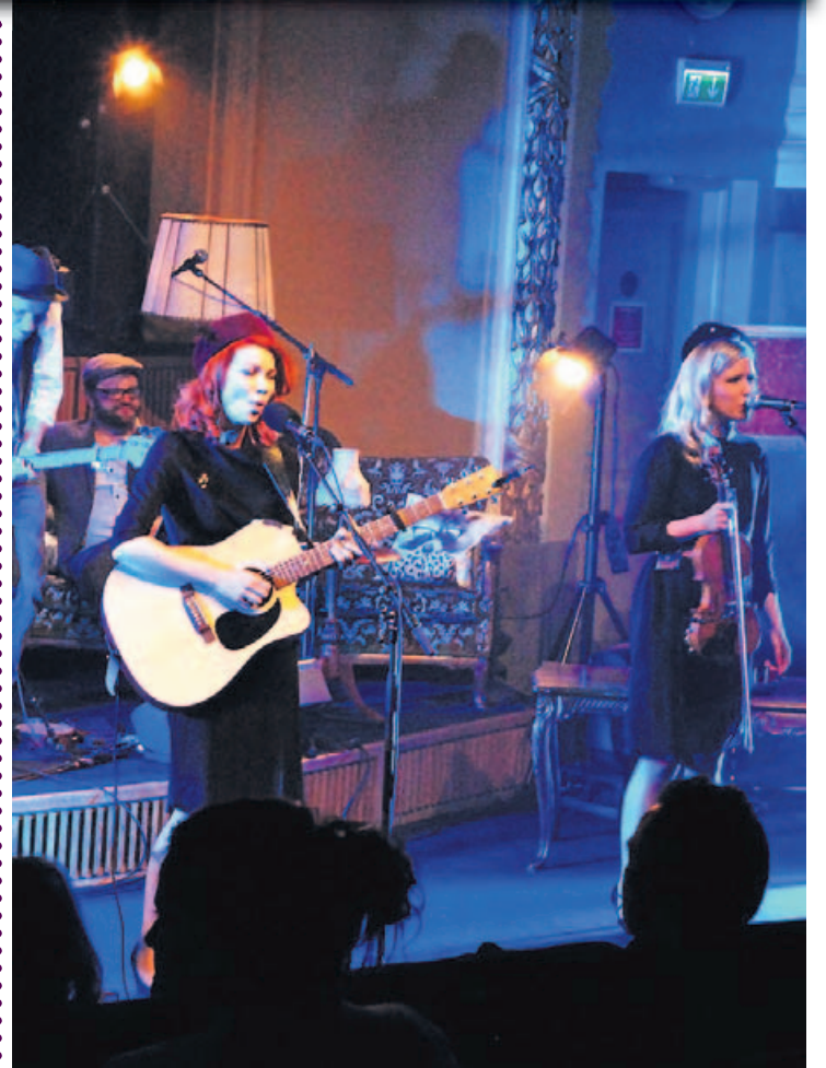
SØT SANG: The Bonbons på Verdensteateret.